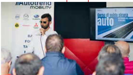
CORSI DI GUIDA