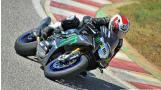
PROVE LIBERE AUTO E MOTO