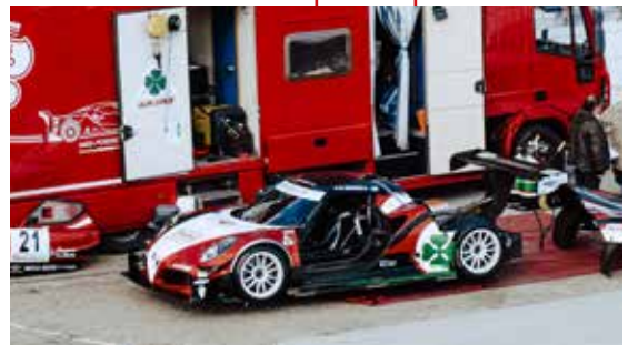
TESTING AUTO E MOTO